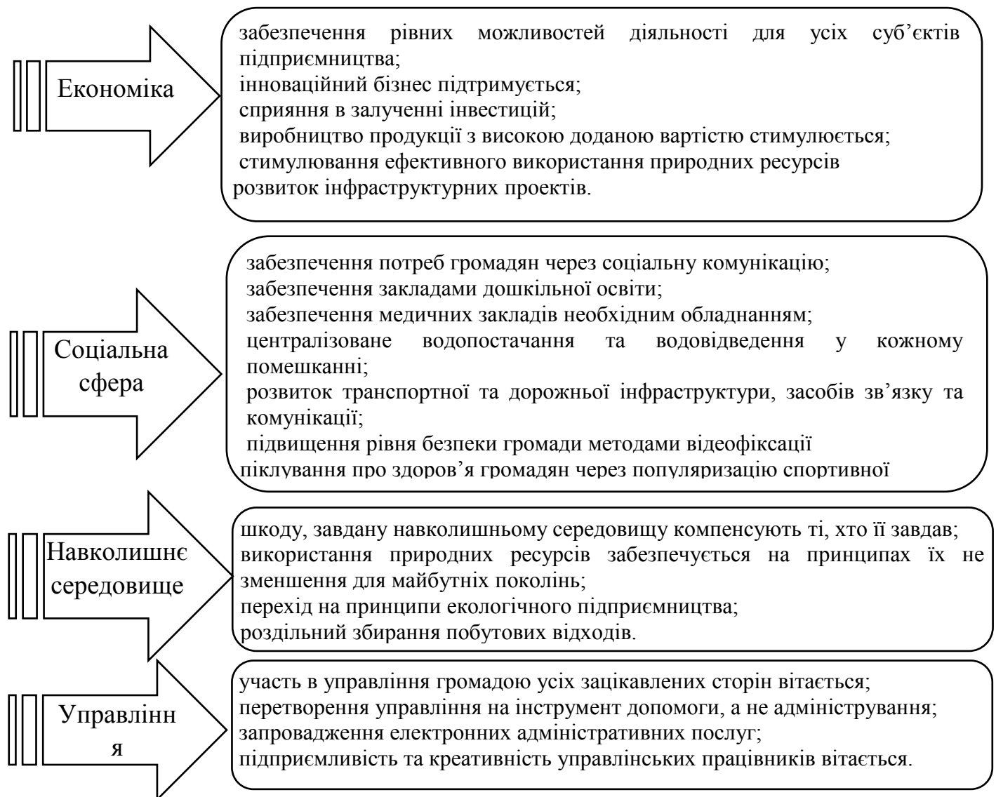
Рис. 3.1. Довгострокові цілі місцевого розвитку

На рис. 3.2. представлено SWOT-аналіз факторів місцевого розвитку, який демонструє сильні та слабкі сторони, можливості і загрози діяльності громади.