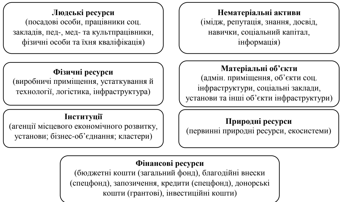
Рис. 2.1. Структура ресурсної бази соціально-економічного розвитку Лобойківського старостату Петриківської селищної ради

Позитивні зміни після проведення адміністративної та бюджетної реформи відразу помітні мешканцям сформованих органів місцевого самоврядування. Найкращим показником є настрій людей у громаді.