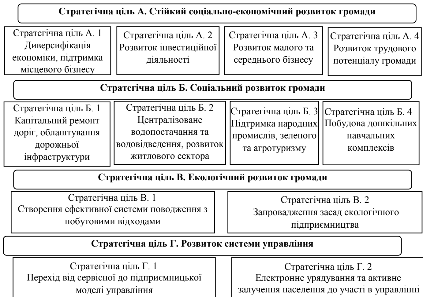
Рис. 3.3. Стратегічні напрями розвитку Лобойківського старостату Петриківської селищної ради

При побудові стратегії соціально-економічного розвитку територіальної громади слід враховувати три напрями руху: екологічний, соціальний, економічний. В сучасних умовах негативного антропогенного навантаження та орієнтування на високі соціальні стандарти життя не можливо не враховувати екологічну складову. На рис. 3.3 представлено систему стратегічних напрямів соціально-економічного розвитку Лобойківського старостату Петриківської селищної ради.