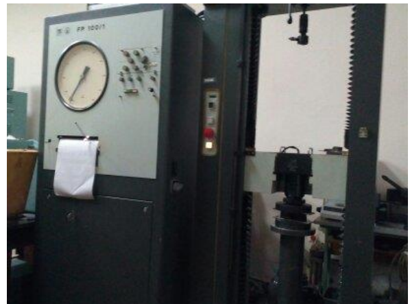
Рисунок 1 – Універсальний стенд FP100/1

Досліджувались гумометалеві елементи циліндричної форми з різною товщиною гумового шару h_p (табл. 1). Металева арматура була приєднана до гумового масиву в процесі вулканізації. У таблиці прийняті наступні позначення: h_m – товщина металу (для всіх елементів h_m = 5 мм); n – кількість елементів у стопці, що підлягають випробуванню; P – сила при стиску елементів; \Delta – деформація стопки елементів; C – статична жорсткість стопки елементів при стиску й витримці її під навантаженням не менш 30 хв. Елементи виготовлялися з середньоонаповненої гуми типу 2959.