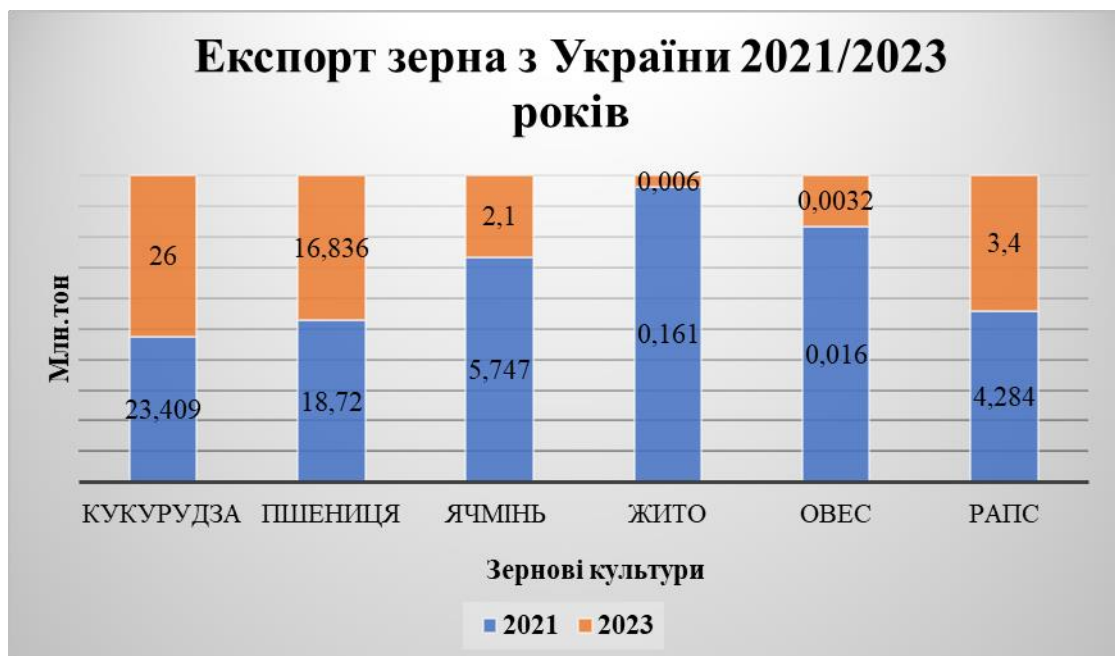
Рис. 1. Експорт зерна з України 2021/2023 рр.

Так для прикладу ми можемо порівняти деякі культури та бачити, що експорт зернових у 2023 році зменшився приблизно на 16% у порівнянні з 2021 маркетинговим роком, при тому як лише кукурудза змогла збільшити свій обсяг (рис.1).