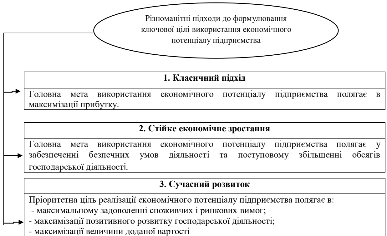
Рис 1. Підходи до означення пріоритетних цілей реалізації економічного потенціалу підприємства

На сьогоднішній день, швидко змінюється глобальне економічне середовище, зростаюча конкуренція, розвиток технологій та зміни в споживчих уподобаннях призвели до того, що максимізація прибутку як єдина пріоритетна ціль стала недостатньою для успішної діяльності підприємства. Сучасні організації повинні враховувати широкий спектр факторів, таких як сталість, стійкість, корпоративна відповідальність, збалансованість інтересів зацікавлених сторін тощо.