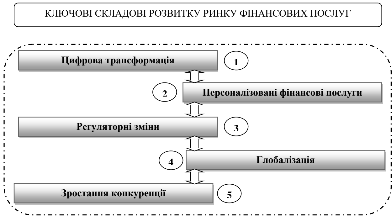
Рис. 2. Ключові складові розвитку ринку фінансових послуг України

постійно еволюціонує під впливом різноманітних факторів, таких як технологічні інновації, регуляторні зміни, демографічні та соціоекономічні тенденції. Існує певна сукупність факторів, які впливають на напрямки розвитку та стратегії небанківського фінансового ринку, створюючи як виклики, так і можливості для учасників цього сектору. Ключові складові розвитку ринку фінансових послуг представлено на рисунку 2.