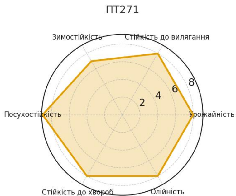
Рис. 3.3. Інтегральний профіль властивостей гібрида ПТ271