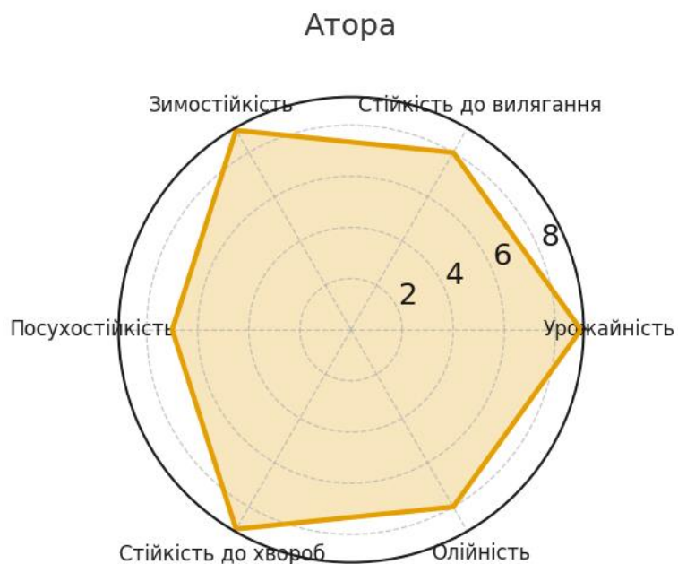
Рис. 3.4. Інтегральний профіль властивостей гібрида Атора