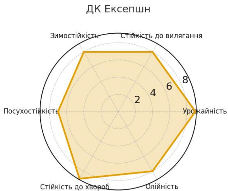
Рис. 3.1. Інтегральний профіль властивостей гібрида ДК Екsepшн