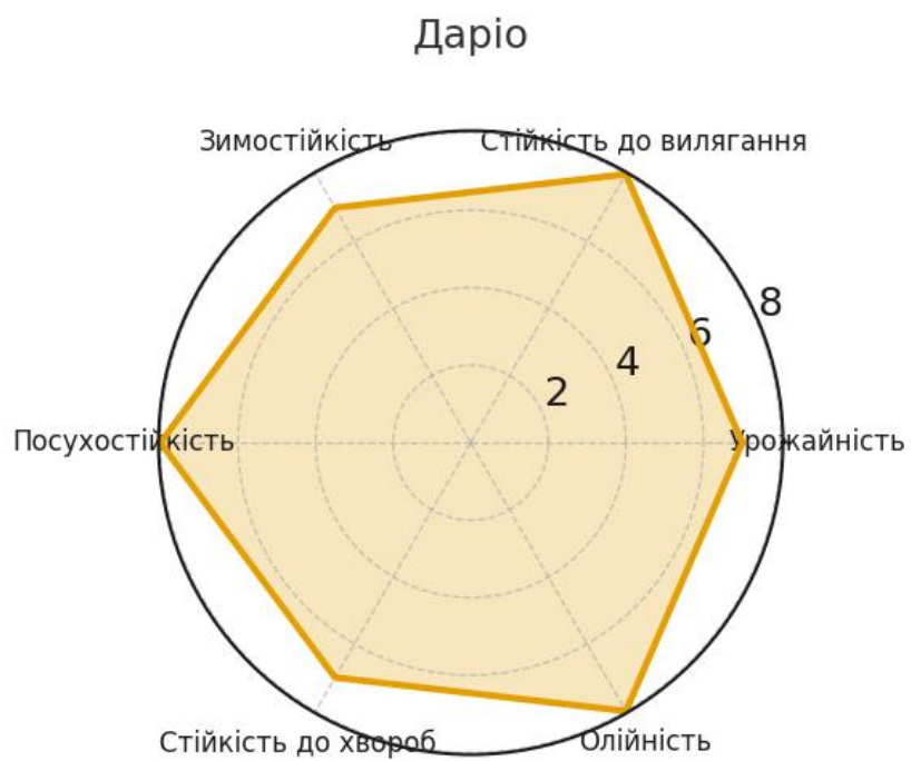
Рис. 3.5. Інтегральний профіль властивостей гібрида Даріо