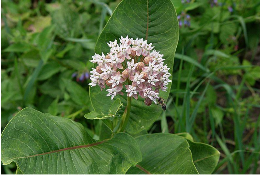
Рис. 1. Яскравий колір та великі китиці ваточника сирійського приваблюють комах-запилювачів

Водночас з тим відмічені і негативні наслідки впливу ваточника сирійського на здоров'я людей. Так період цвітіння цих рослин збігається з сезоном найбільшого страждання від сінної лихоманки, тому вважають що його пилок може викликати симптоми сінної лихоманки. Але на основі проведених досліджень з вивчення поширення пилку ваточника сирійського встановлено, що в основному з-за своїх розмірів зерен і ваги пилок розноситься комахами або падає на землю недалеко від рослин. Лише зрідка, в суху, дуже вітряну погоду пилок ваточника сирійського може бути перенесений вітром і таким чином викликати алергію в людей з підвищеною чутливістю (Frankton 1963) [55].