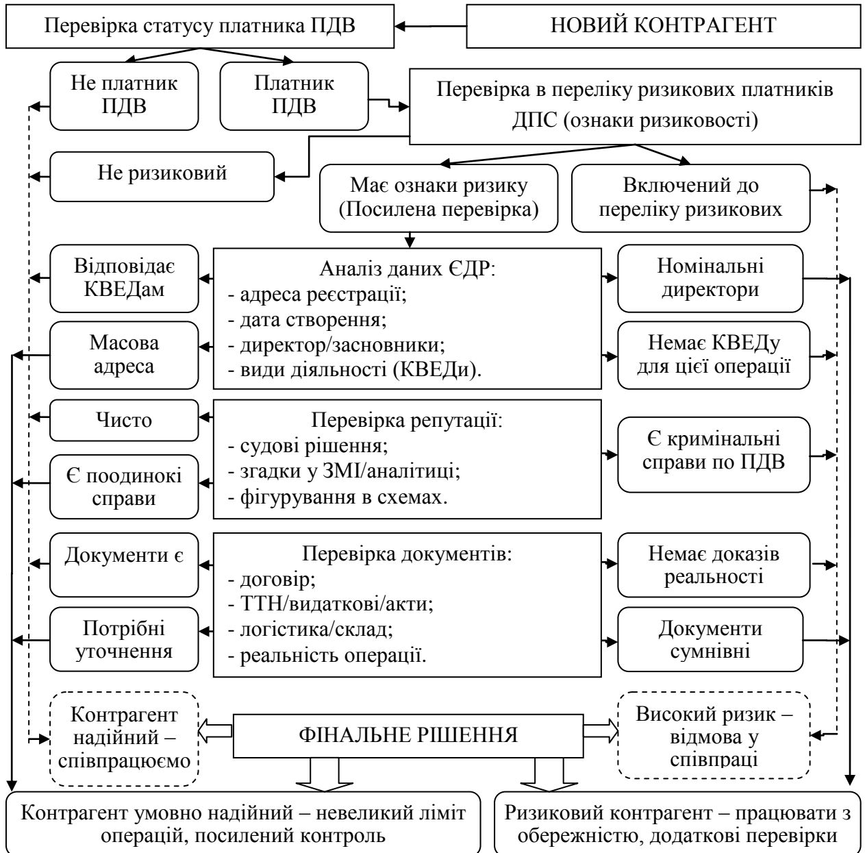
Рис. 3.1. Алгоритм оцінка ризиковості контрагента з ПДВ

співпраця може бути обмежена або відхилена.