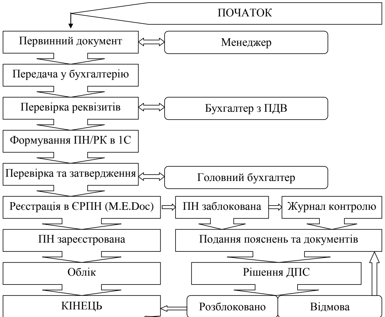
Рис.2.4. Блок-схема рух документів з ПДВ в ТОВ «СЕЙВ ПРО СОЛЮШИНС»

Одним із ключових напрямів підвищення ефективності організації обліку податку на додану вартість у ТОВ «СЕЙВ ПРО СОЛЮШИНС» є розроблення та впровадження стандартизованої блок-схеми руху документів з ПДВ. Нині на підприємстві відсутній формалізований порядок передавання, перевірки, узгодження та реєстрації документів, що створює ризики втрати первинних документів, порушення строків реєстрації податкових накладних, виникнення помилок у податковому кредиті та податкових зобов'язаннях.