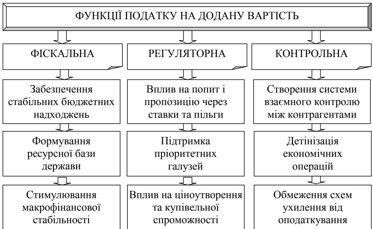
Рис. 1.1. Структурно-логічна характеристика основних функцій ПДВ

Завдяки особливому механізму справляння ПДВ виконує не лише фіскальні, а й регуляторні та контрольні функції, забезпечуючи прозорість господарських операцій і сприяючи детінізації економіки. Структурно-логічну характеристику основних функцій ПДВ подано на рисунку 1.1.