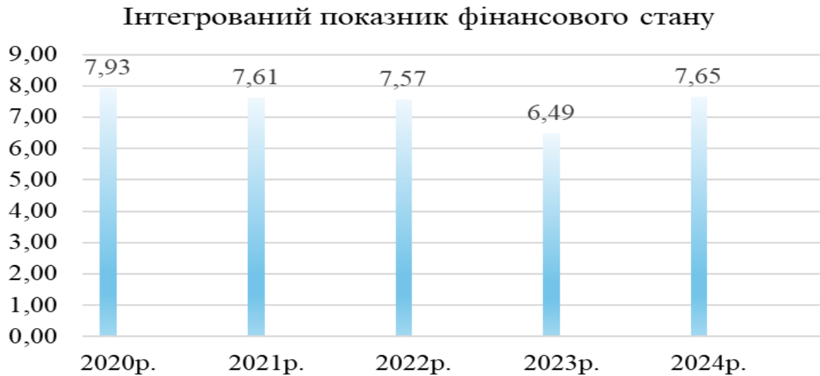
Рис. 2.1. Динаміка інтегрованого показника фінансового стану ТОВ «СЕЙВ ПРО СОЛЮШИНС» за 2020–2024 рр.

коефіцієнт поточної ліквідності підвищився з 0,73 до 0,87, а швидкої з 0,71 до 0,85. Це вказує на поступове покращення здатності підприємства покривати короткострокові зобов'язання, хоча значення все ще нижчі за рекомендовані, що потребує подальшої роботи з оптимізації структури активів.