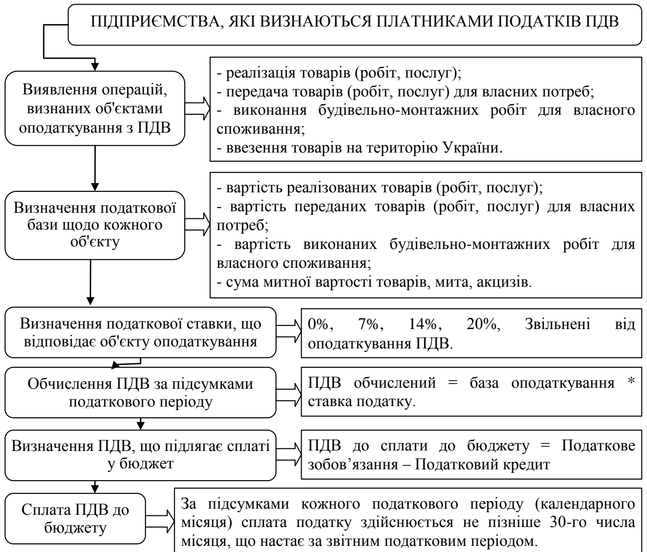
Рис. 1.4. Процес обчислення податку на додану вартість

е) сплата ПДВ здійснюється платниками податків за підсумками кожного податкового періоду не пізніше 30-го числа календарного місяця, що настає за звітним періодом. Платники податків зобов'язані подати до контролюючих органів податкову декларацію з ПДВ у строк не пізніше 20-го числа місяця, що настає за звітним періодом (ст. 203, 204 ПКУ) [22]. Подані етапи на рисунку 1.4 узагальнюють процес обчислення та сплати ПДВ.