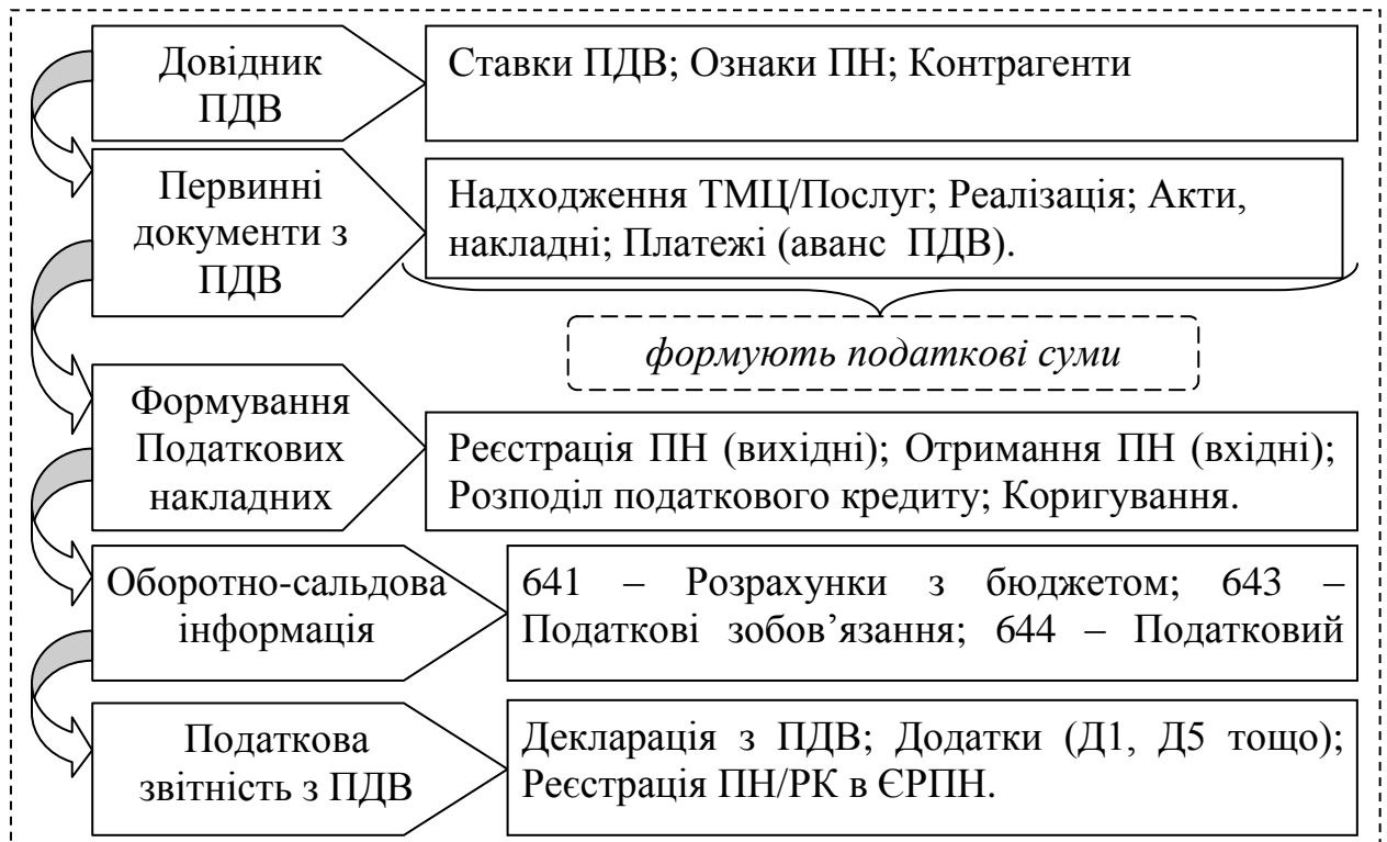
Рис. 2.3. Схема організації обліку ПДВ в «1С: Підприємство 8.3» ТОВ «СЕЙВ ПРО СОЛЮШИНС»

Узагальнена схема організації обліку ПДВ в «1С: Підприємство 8.3», наведена на рисунку 2.3 він відображає логіку руху документів, проводок і формування звітності.