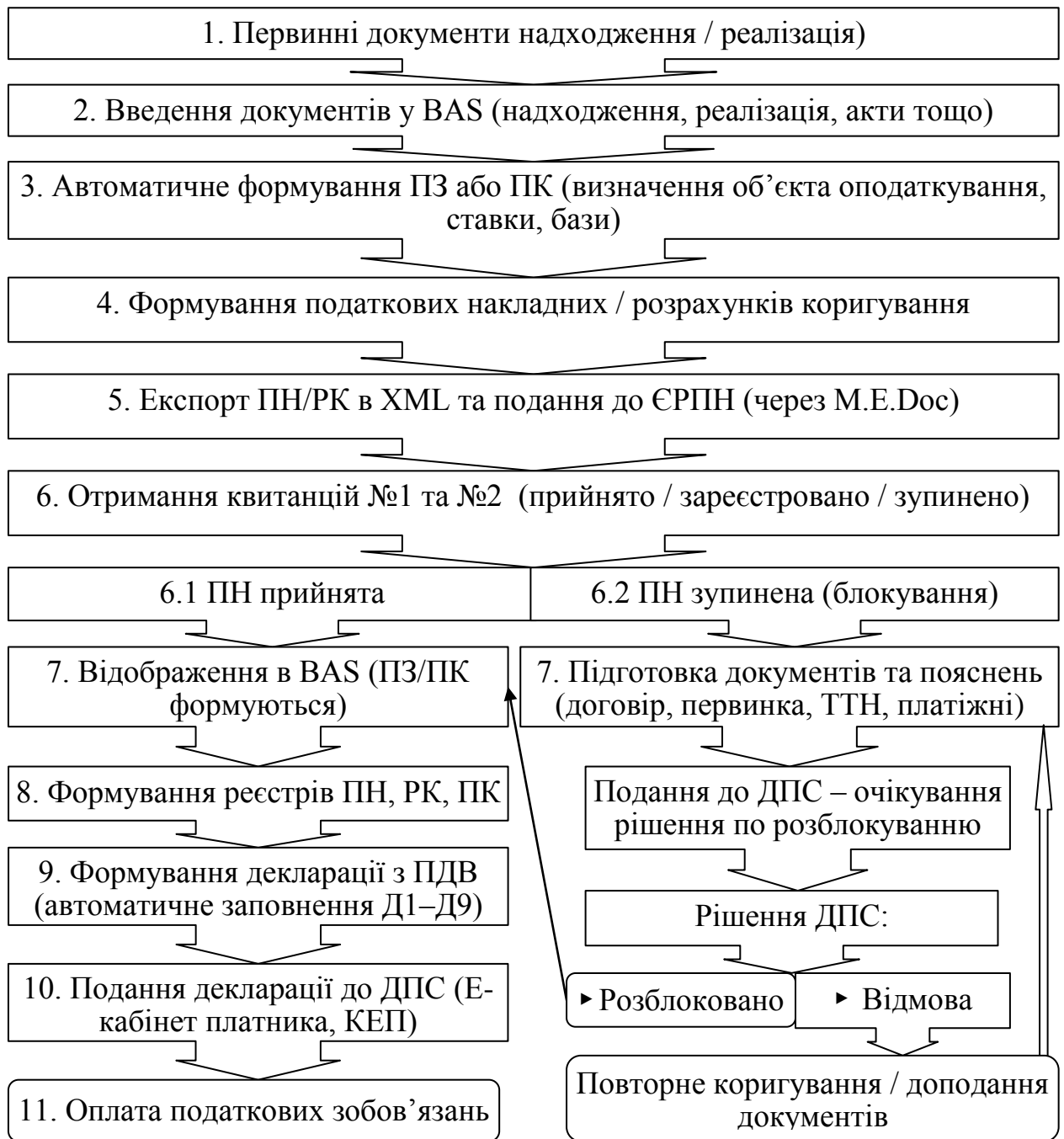
Рис. 2.5. Схема процесу обліку ПДВ в BAS

Особливе місце в BAS займає механізм формування податкових накладних та розрахунків коригування. Програма дозволяє створювати їх як вручну, так і на підставі первинних документів – реалізації, передоплати, повернення товару тощо. Система автоматично визначає дату складання ПН згідно з правилом «першої події» або відповідно до спеціальних режимів (зведені ПН, самонарахування, умовні постачання). Документ «Податкова накладна» заповнюється автоматично: номенклатура, коди, ціни, ставки ПДВ