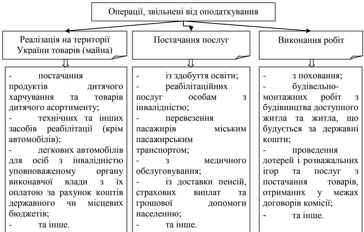
Рис. 1.2. Окремі види операцій, які звільняються від оподаткування [22]

Повідомлення та документи подаються не пізніше 20-го числа місяця, починаючи з якого платники податків використовують право на звільнення від сплати податку на додану вартість.