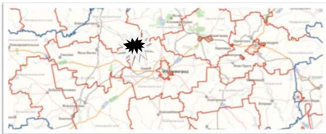
Місцерозташування фермерського господарства