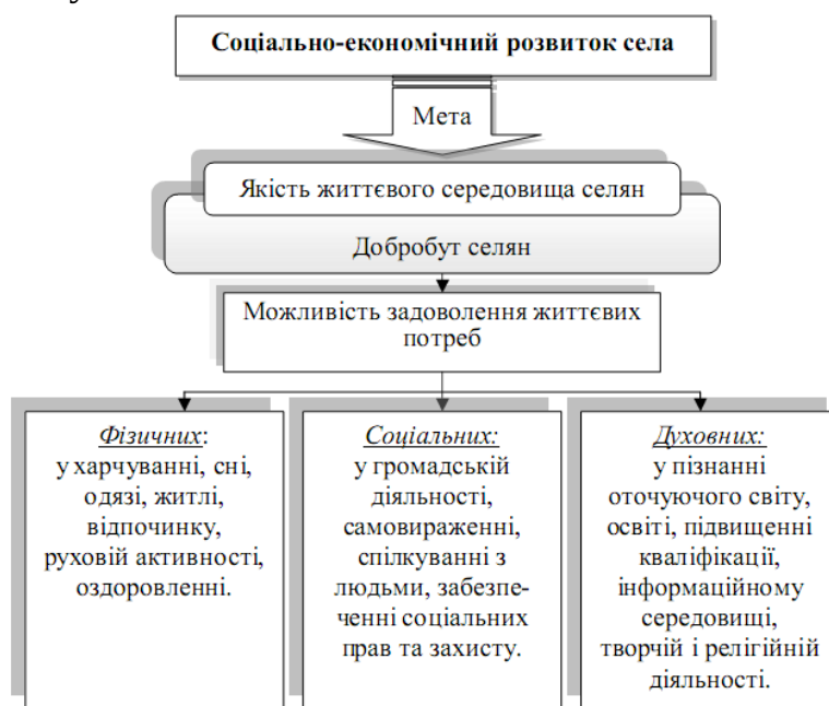
Рис. 1. Формування мети соціально-економічного розвитку села в контексті людських потреб

З другого боку, використання досвіду, теоретичних і емпіричних напрацювань країн ЄС, особливо - колишніх постсоціалістичних країн Центральної та Східної Європи, дозволить наблизити вітчизняну політику РСТ до європейських норм і вимог. А це відповідає стратегічним завданням економічної політики нашої країни. Узагальнення поглядів сучасних вчених дозволило визначити мету соціально-економічного розвитку села як забезпечення якісного життєвого середовища селян. Саме цей індикатор здатний максимально повно характеризувати стан села, оскільки він об'єднує всі складові. При цьому добробут реалізується через сукупність потреб людини, які вона в змозі задовольнити у процесі життєдіяльності (рис. 1.). На основі узагальнення досвіду стимулювання розвитку сільських територій у ЄС можливо зробити висновок, що ключовою особливістю, яка вирізняє європейський підхід до досліджуваної проблеми з-поміж інших, є визнання неможливості розвитку сільського господарства без розвитку сільських територій, що досягається завдяки координації та взаємодії в рамках Спільної аграрної політики двох її основ - ринкової політики та політики сільського розвитку.