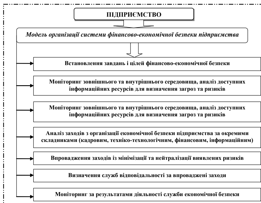
Рис. 2. Модель організації системи фінансово-економічної безпеки підприємства