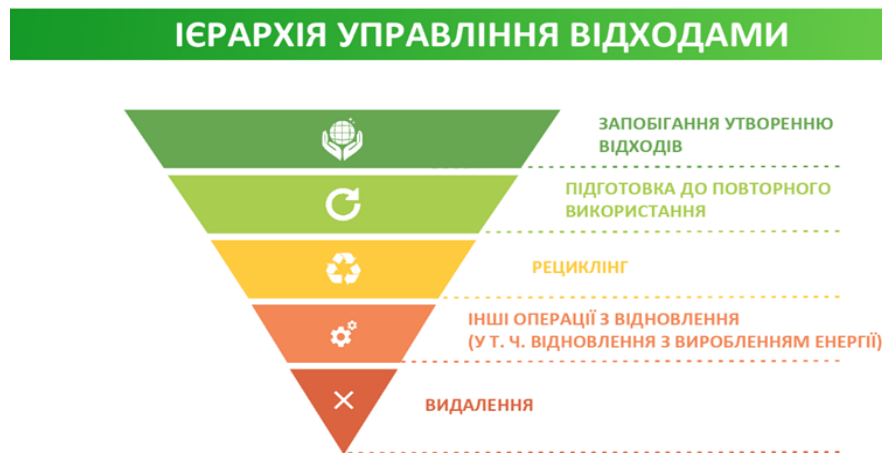
Рисунок 1.1- Ієрархія управління відходами [6].

М'ясопереробна промисловість є однією з галузей, що продукує значні обсяги органічних відходів різного типу: рідкі стоки, кров, залишки м'яса та нутрощів, кістки, жирові відходи та інші побічні продукти. Ці відходи не можна просто утилізувати, оскільки вони становлять як екологічну загрозу, так і цінний