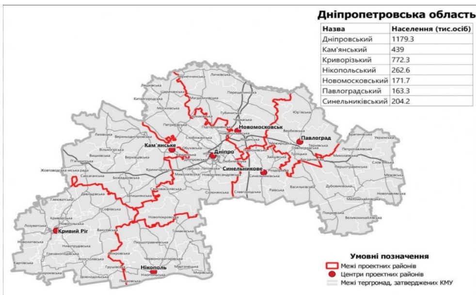
Рисунок 2.1 – Територіальний поділ Дніпропетровської області

Дніпропетровська область є одним із найбільших регіонів України та посідає важливе місце в її адміністративно-територіальній структурі. Територія області охоплює 31,9 тис. км 2 і характеризується центральним та частково південно-східним положенням у межах держави, що забезпечує їй стратегічні транспортні, економічні та комунікаційні переваги. Розташування області в центрі країни формує зручні умови для розвитку промисловості, переробного комплексу, логістики та аграрного сектора. Водночас таке положення зумовлює високий рівень урбанізації, значну щільність населення та підвищені вимоги до екологічної організації промислових підприємств. Географічна структура регіону відзначається його положенням у степовій зоні України, що істотно