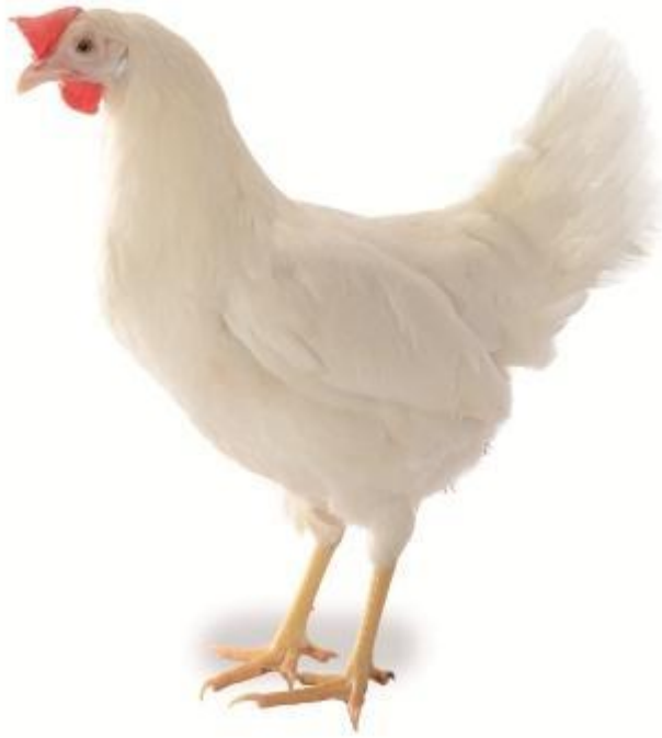
Рис. 2. Птиця кросу “Ломанн ЛСЛ-класік”

Несучки починають яйцекладку рано і швидко доводять її до пікової (91 %) у середньому по стаду в 29 тижнів. На початкову несучку за період від 18 до 70 тижнів отримують в середньому по 273 яйця, що говорить про дуже незначний її відхід при вирощуванні. При цьому до періоду початку яйцекладки несучка має лише 1,2 кг живої маси, а до кінця яйцекладки – 1,7 кг. Невелика маса за такої продуктивності свідчить про невеликі витрати корму та ефективність її утримання. На вирощування до 18 тижнів однієї молодки витрачається 6 кг корму. Добове споживання корму несучкою трохи більше 100 г. На десяток яєць витрачається 1,62 кг корму.