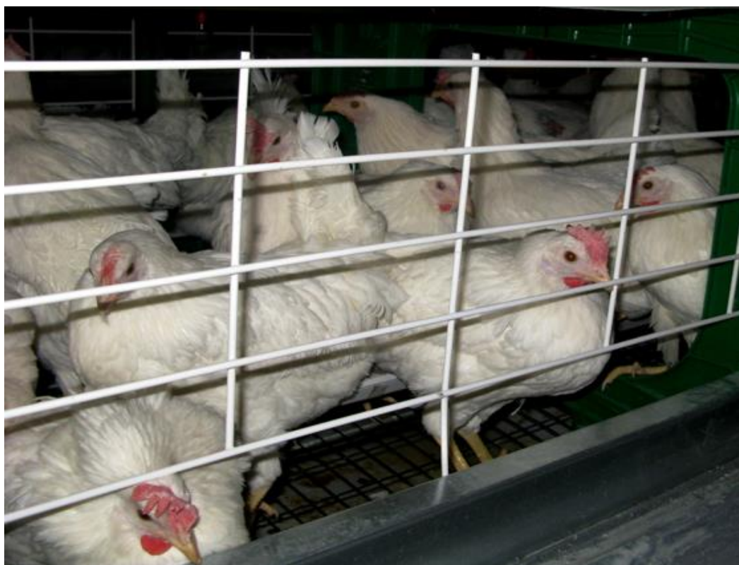
Рис. 1. Крос “Ломанн ЛСЛ-Лайт”

Ячний крос “Ломанн ЛСЛ-Лайт” (рис.1) був створений на основі породи ячного напрямку Леггорн. Особливості кросу такі: високі показники продуктивності курей, маси яєць на початку несучості, білий колір та міцність шкаралупи яєць.