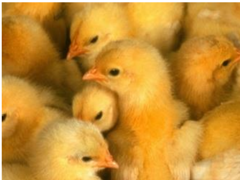
Рис. 3. Добові курчата кросу “Ломанн ЛСЛ-Лайт”

У курей яєчних порід найбільш поширений листовидний гребінь, який спадає набік. Курчата при народженні важать 30-35 г. Птиця яєчних порід більш скоростигла, ніж м'ясо-яєчних.