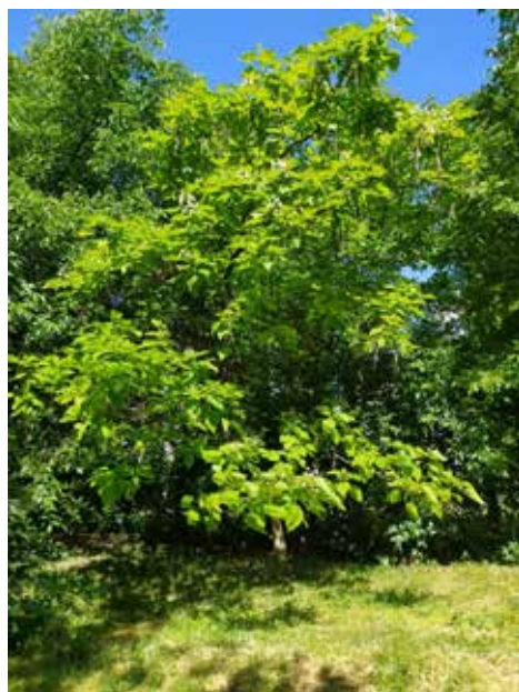
Ділянка 4 (ж/м Тополя-3)