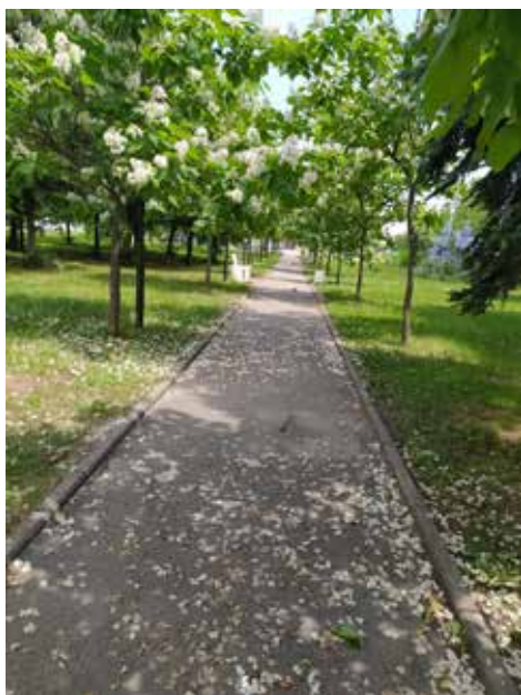
Ділянка 1 (парк відпочинку смт. Обухівка)

Приріст річних пагонів і довжину міжвузлів визначали загальновідомими методами [33]. Товщину пагонів вимірювали електронним штангенциркулем VerkeV8600. Площу листків встановлювали ваговим методом [34].