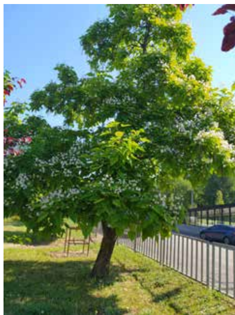
Ділянка 2 (пр. О. Поля)