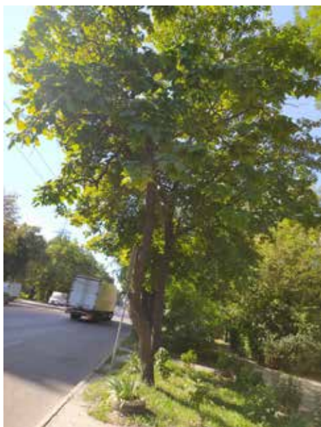
Ділянка 3 (пр. Б. Хмельницького)