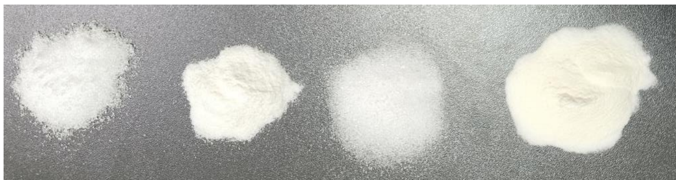
Рисунок 2.1 – Цукрозамінники, використані у дослідженні: 1 – ксилітол, 2 – екстракт стевії; 3 – еритритол, 4 – інулін з цикорію

Компонентний склад дослідних зразків печива цукрового наступний: борошно пшеничне вищого сорту ТМ «Дніпромлин», пудра цукрова ТМ «Manik», молоко питне ультрапастеризоване ТМ «Галичина», маргарин столовий ТМ «Щедро», інвертний цукровий сироп ТМ «Cristalco», крохмаль кукурудзяний ТМ «Сто Пудів», сіль ТМ «Артемсіль», яйця курячі ТМ «Ясенвіт», сода харчова ТМ «Розумний вибір». Використано наступні цукрозамінники (рис. 2.1): ксилітол ТМ «Natura Vena», екстракт стевії ТМ «SteviaSun», еритритол ТМ «Fruity Yummy» та інулін з цикорію ТМ «Fruity Yummy».