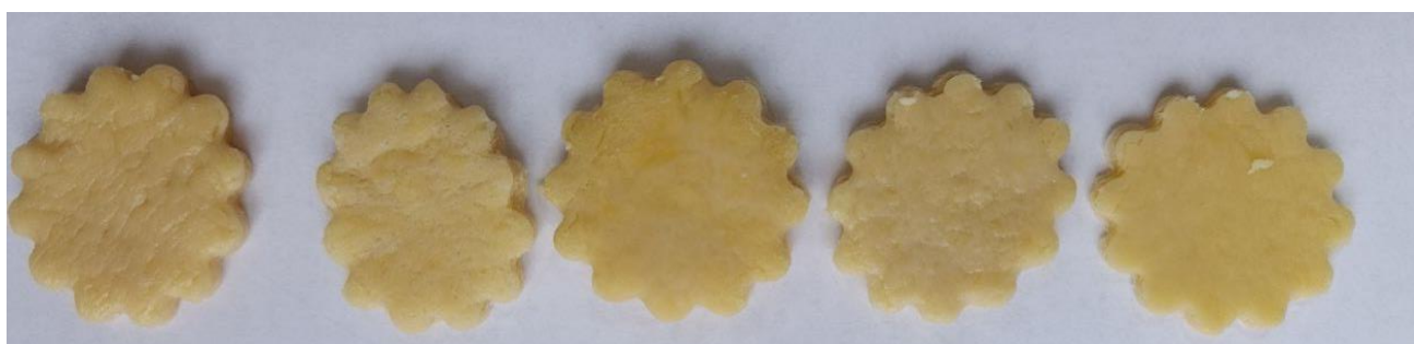
Рисунок 2.4 – Тістові заготовки дослідних зразків печива цукрового

У процесі визначення органолептичних показників якості дослідних зразків цукрового печива орієнтувалися на ДСТУ 3781:2014 «Печиво. Загальні технічні умови». Реологічні властивості готових виробів визначали за допомогою пенетрометра (рис. 2.5).