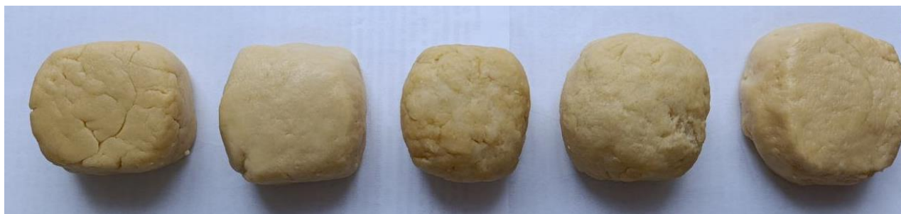
Рисунок 2.3 – Тісто для виготовлення печива цукрового, передбаченого дослідженням