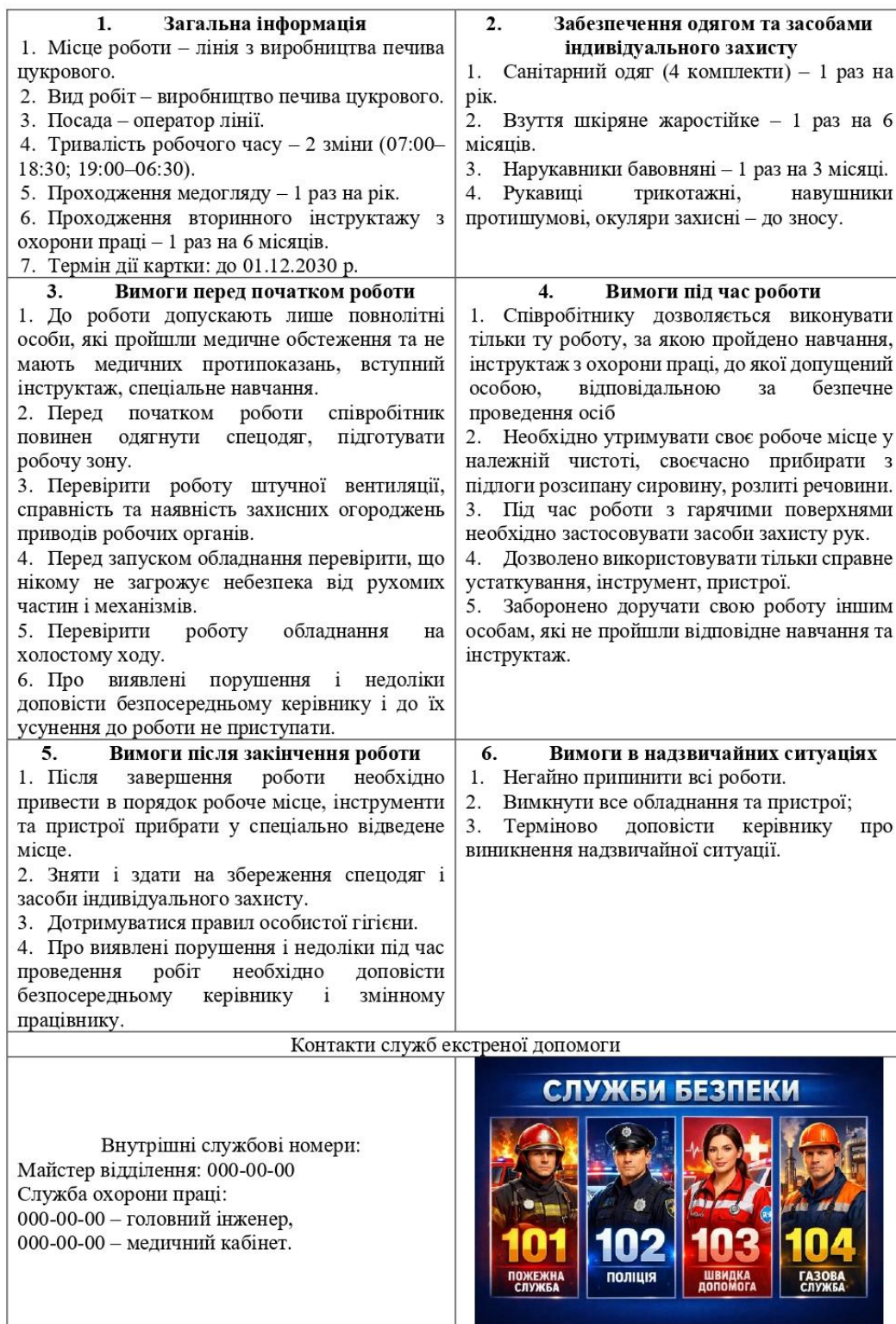
Рисунок 4.1 – Картка безпека праці

Забороняється працювати на обладнанні з несправними огороженнями або при відсутності заземлення. Очищення, змащування та ремонт машин дозволяється виконувати лише після їх повного зупинення та відключення від електромережі. Усі