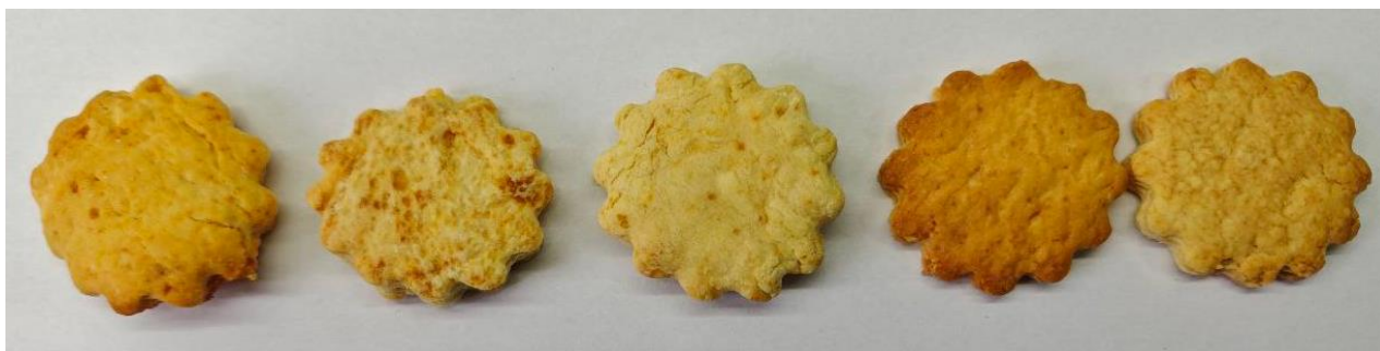
Рисунок 3.1 – Загальний вигляд зразків печива цукрового (зліва на право): 1 – контрольний зразок (із використанням пудри цукрової); 2 – із використанням ксилітолу; 3 – із використанням екстракту стевії; 4 із використанням еритритолу; 5 – із використанням інуліну з цикорію

У таблиці 3.1 наведено результати визначення органолептичних показників якості контрольного і дослідних зразків печива (рис. 3.1) із використанням цукрозамінників.