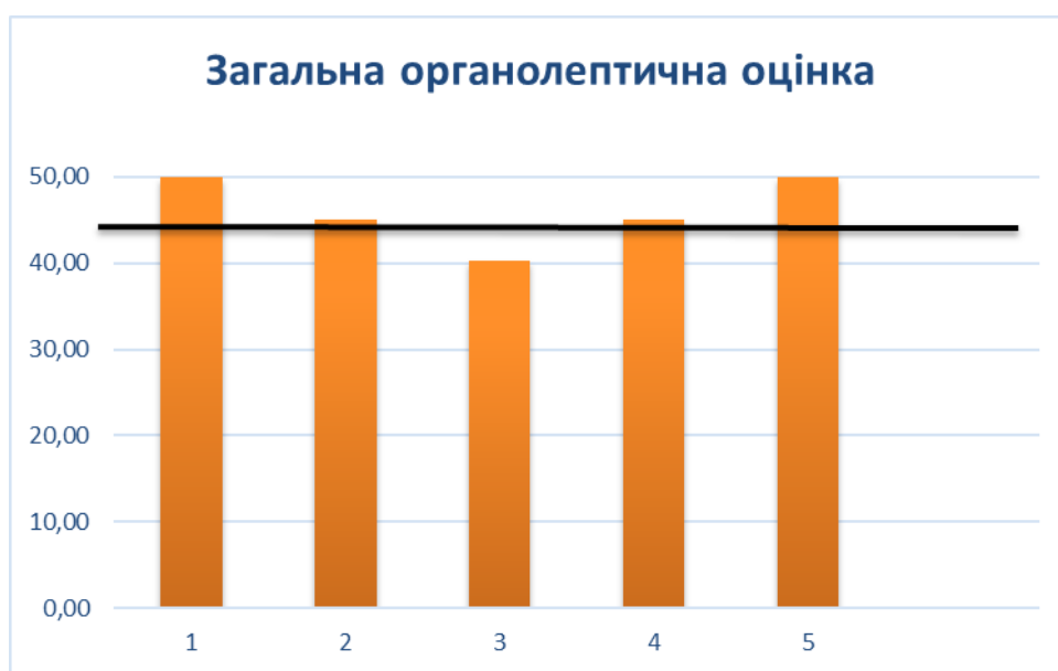
Рисунок 3.3 – Загальна органолептична оцінка