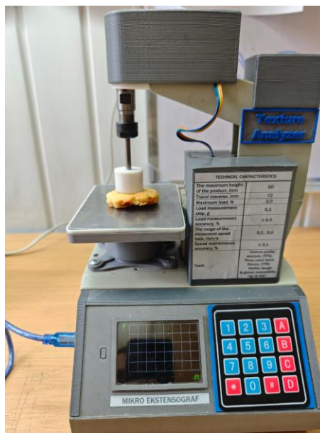
Рисунок 2.5 – Визначення реологічних властивостей дослідних зразків печива