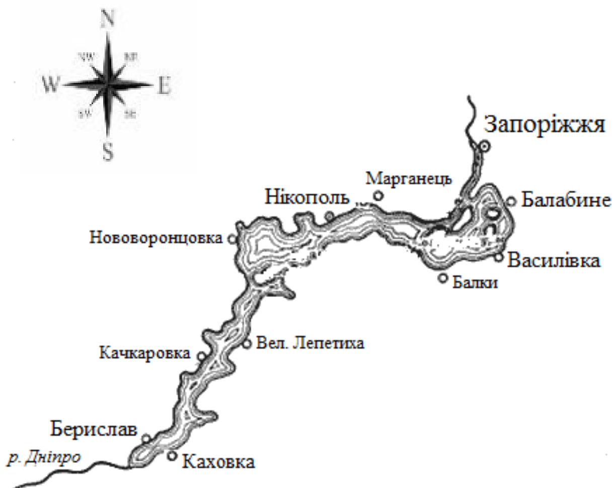
Рис. 1.1. Карта-схема Каховського водосховища – району проведення досліджень

Каховське водосховище – це штучна водна екосистема на р. Дніпро площею водного дзеркала 215,5 тис. га. Воно створено в 1955 р. на р. Дніпро в Херсонській області при спорудженні Каховської ГЕС [18]. Заповнення водосховища відбувалось після побудови греблі Каховської ГЕС протягом 1955–1958 років. У верхній течії (м. Запоріжжя) водосховище обмежено греблею Дніпрогесу (рис. 1.1), у пониззі – Каховським гідровузлом (м. Каховка).