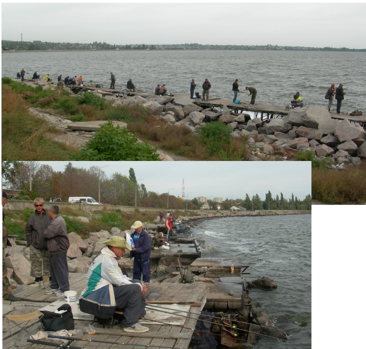
Рис. 1.3. Рибалки-любителі м. Нікополь на березі Каховського водосховища (осінь 2021 р.)

У прибережжі Каховського водосховища здійснюється любительський лов риби, здебільшого, неорганізованими рибалками-любителями (з берега)(рис. 1.3).