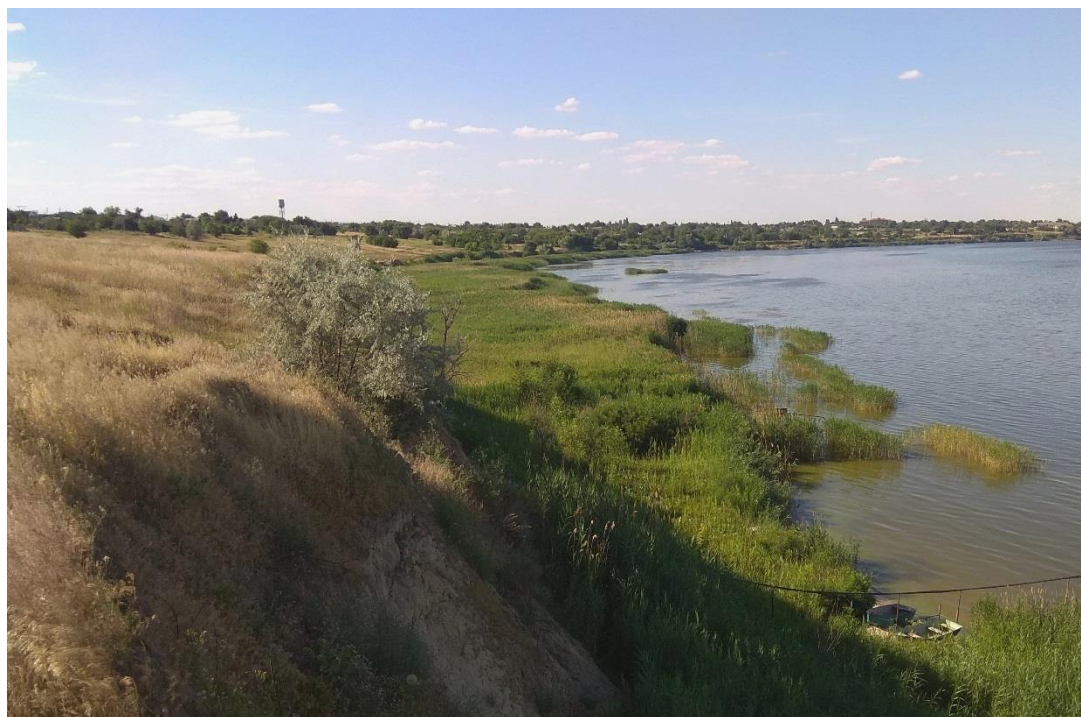
Рис. 1.2. Типові краєвиди середньої ділянки Каховського водосховища