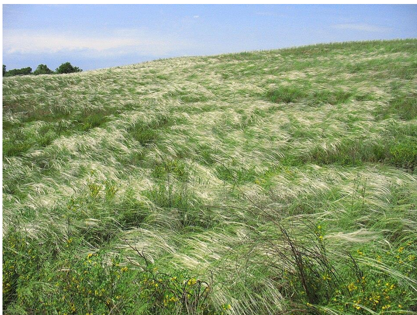
Рисунок 2.3 – Степ із ковилою дніпровською [19]

Особливу цінність флори Дніпропетровщини становлять рідкісні та малопоширені види рослин. Значну частку серед них займають ендеміки, ареали яких обмежені піщаними терасами Дніпра і Сіверського Дінця або просторами Причорноморських степів. Назви багатьох із них відображають місця поширення: волошка дніпровська, ковила дніпровська, жовтозілля дніпровське, астрагал понтичний та інші. У заповідних лісових, лучних і болотних урочищах Присамар'я, Приорілля та Дніпровської долини збереглися унікальні рослинні комплекси Степового Придніпров'я.