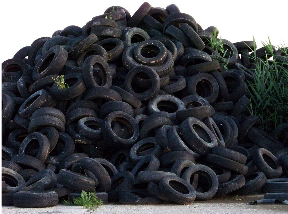
Рисунок 1.1 – Складання використаних автомобільних шин на відкритому повітрі [10]

На рис. 1.1 зображено складання використаних автомобільних шин на відкритому повітрі.