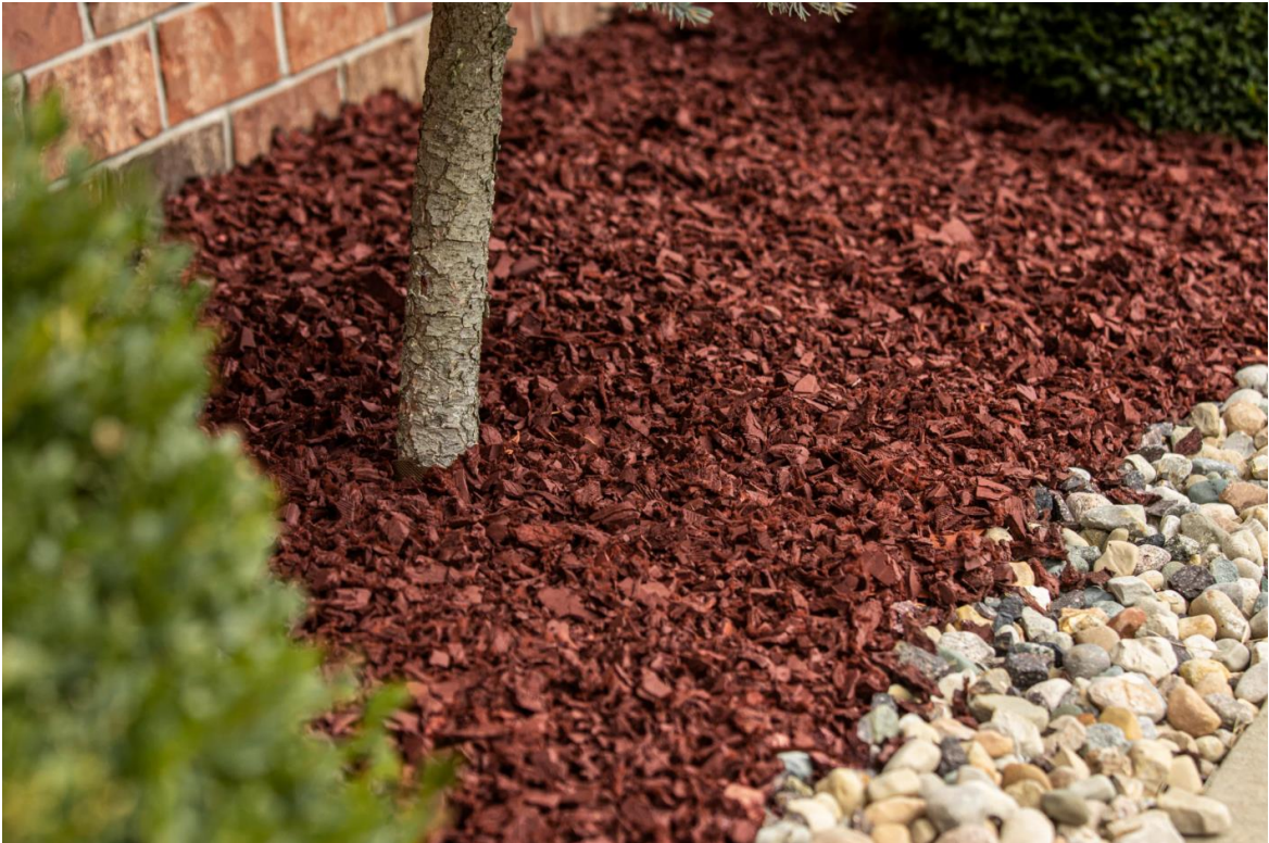
Рисунок 1.6 – Гумова Мульча [13]