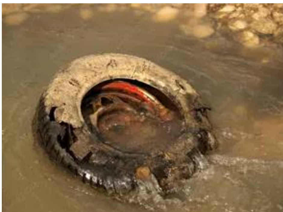
Рисунок 1.2 – Забруднення водних об'єктів відпрацьованими автомобільними шинами [5]

На рис. 1.2 зображено забруднення водних об'єктів використаними автомобільними шинами.