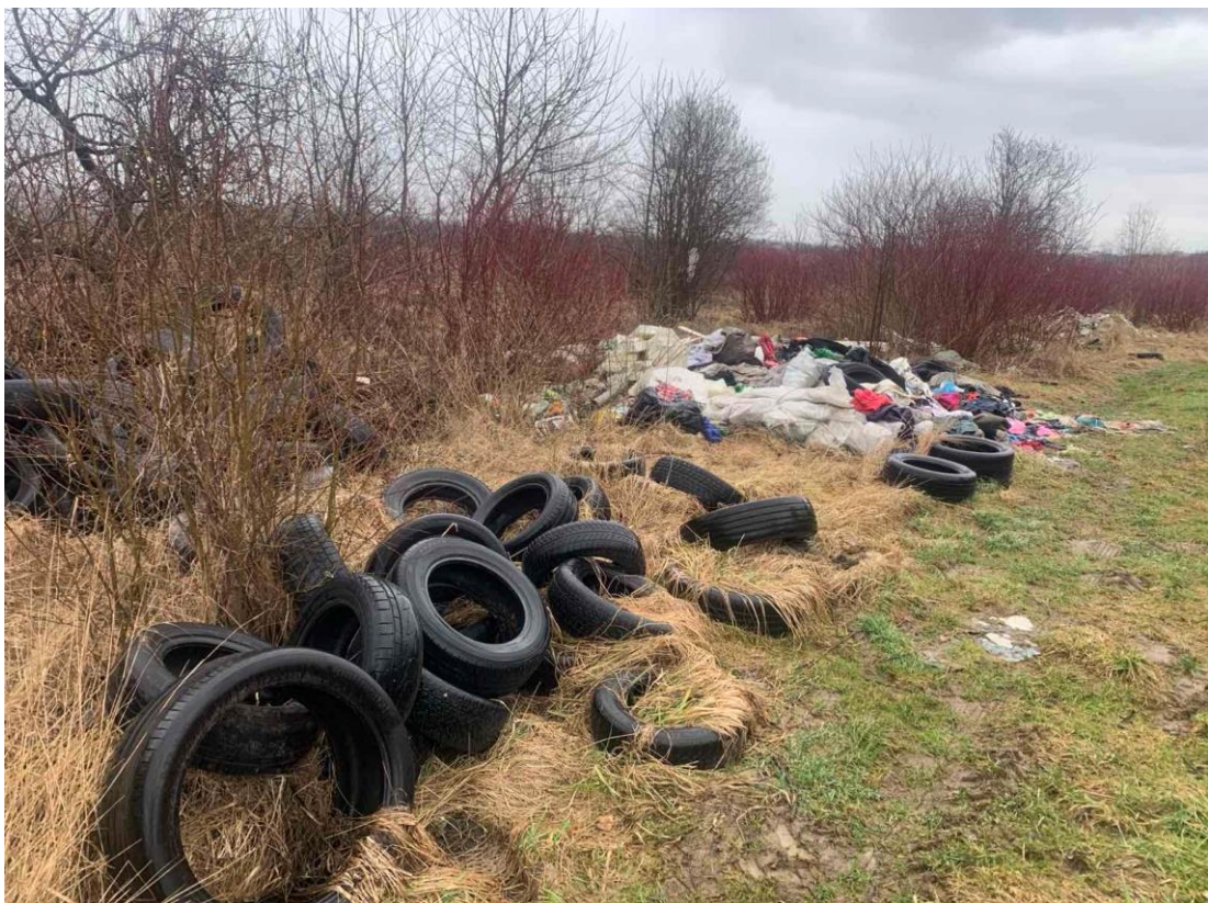
Рисунок 1.3 – Звалище автомобільних шин [10]

На рис. 1.3 показано приклад сміттєзвалища, засипаного відпрацьованими автомобільними шинами.