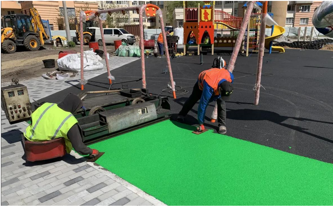
Рисунок 1.4 – Процес укладання покриття з гумової крихти [12]