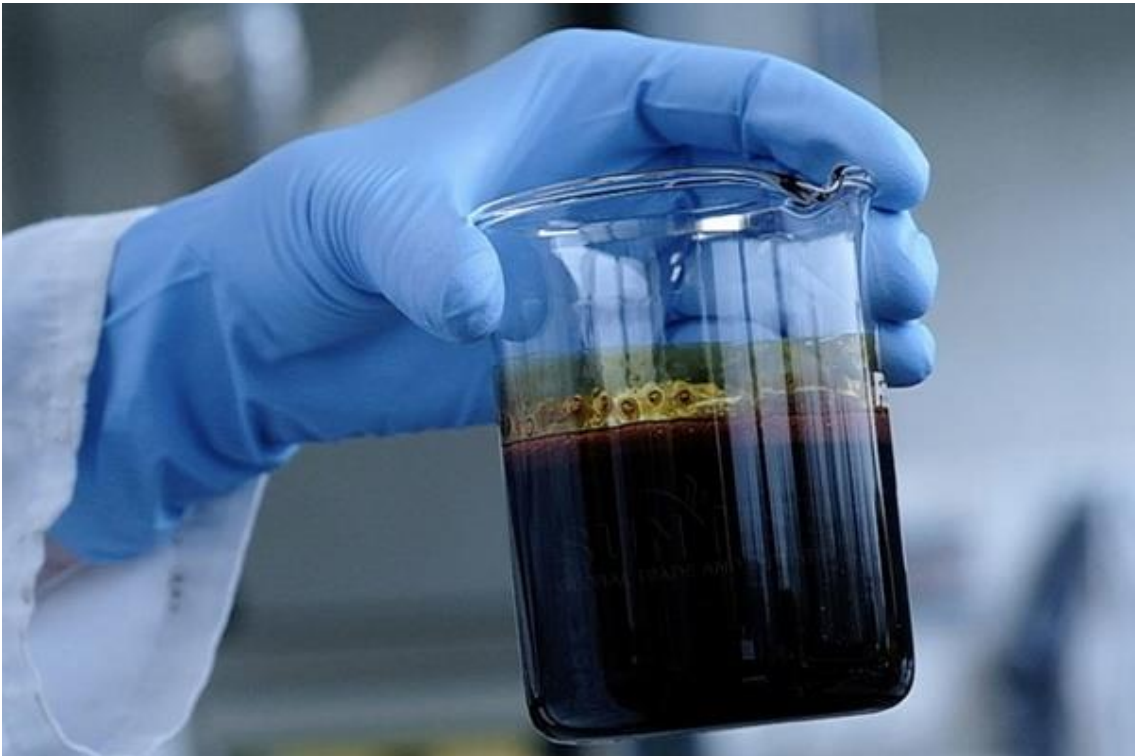
Рисунок 1.5 – Піролізне масло відпрацьованих шин [11]