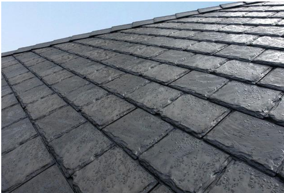
Рисунок 1.7 – Екологічна черепиця, виготовлена з перероблених шин [14]

З перероблених шин виготовляють також покрівельні матеріали, зокрема черепицю та мембрани (див. рис. 1.7). Такі вироби характеризуються тривалим терміном служби, стійкістю до різких погодних змін, а також гарними тепло- і звукоізоляційними властивостями. Використання прогумованих покрівельних матеріалів зменшує потребу у традиційних покрівельних ресурсах і сприяє екологічно безпечному будівництву.