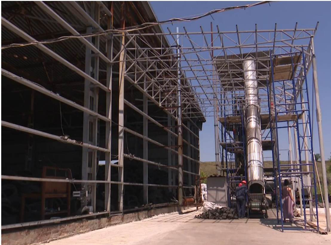
Рисунок 3.1 – Завод з переробки гумових покришок

З перероблених шин, за словами представників заводу, отримують кілька компонентів — гумову крихту, а також інші матеріали, які можна використовувати в лакофарбовій галузі або для дорожнього будівництва.