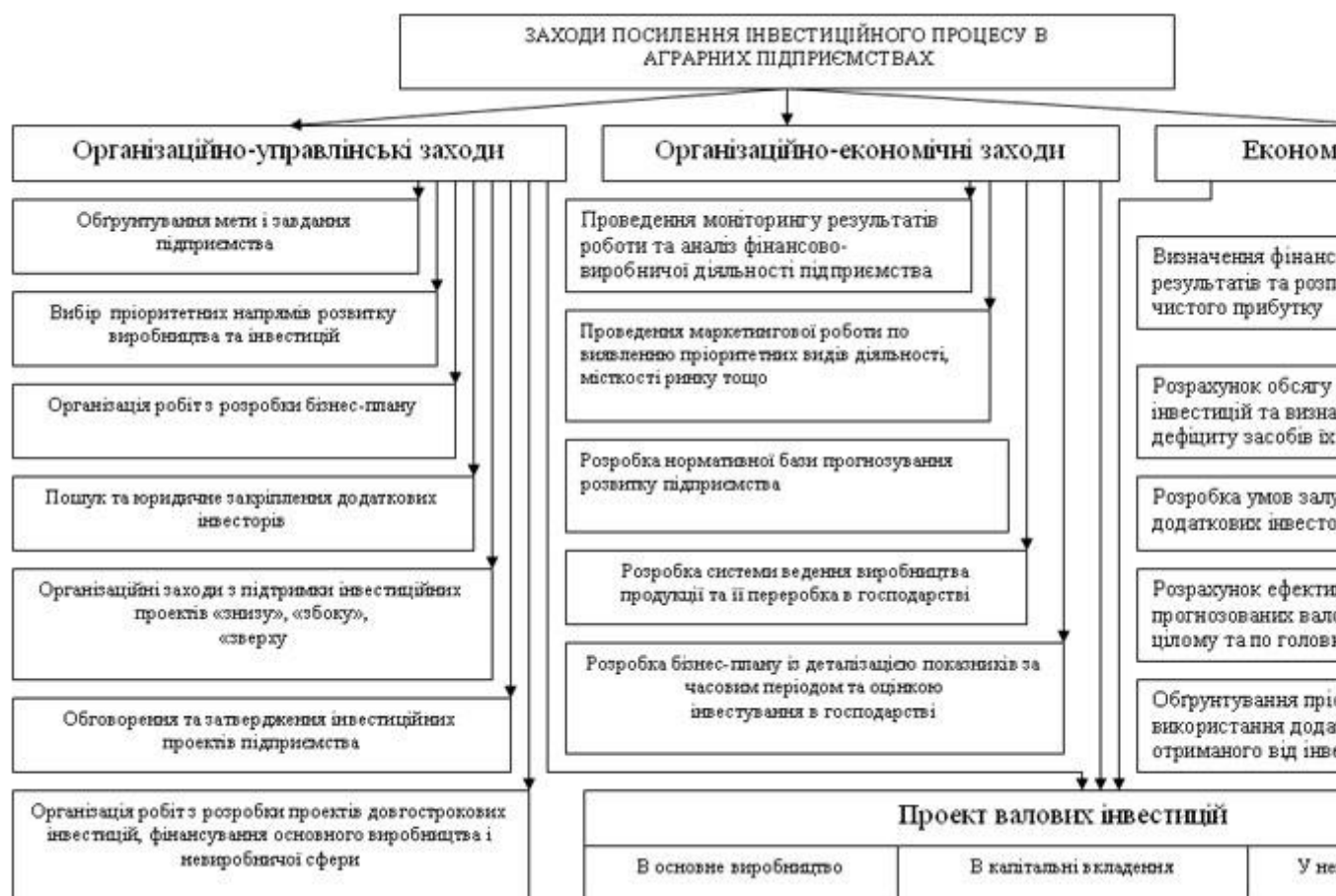
Рис. 2. Система основних заходів посилення інвестиційного процесу в аграрних підприємствах

Для посилення й прискорення інвестиційного процесу, підвищення ефективності інвестиційної діяльності, разом з розробкою інвестиційних програм та проектів соціально-економічного розвитку, на нашу думку, кожне сільськогосподарське підприємство мусить здійснити цілий комплекс заходів щодо забезпечення інвестицій. Основні з них наведені на рисунку 2.