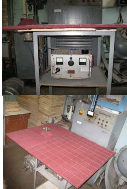
Рисунок 1 – Експериментально-дослідна установка

Дослідження були проведені на різних конструкціях робочих органів і робочим матеріалом був пісок та гранульовані мінеральні добрива (розмір гранул 1 мм).